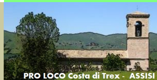
PRO LOCO Costa di Trex - ASSISI

PRANZO FINE TRAIL ore 13,00 Da prenotare esclusivamente entro il 05 agosto 2016 Pranzo menu fisso ( bevande escluse) e iscrizione al Trail € . 23,00 Per gli accompagnatori: solo pranzo € . 15,00